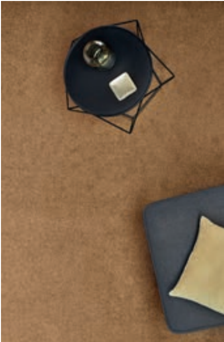
Réf. Sahara 370